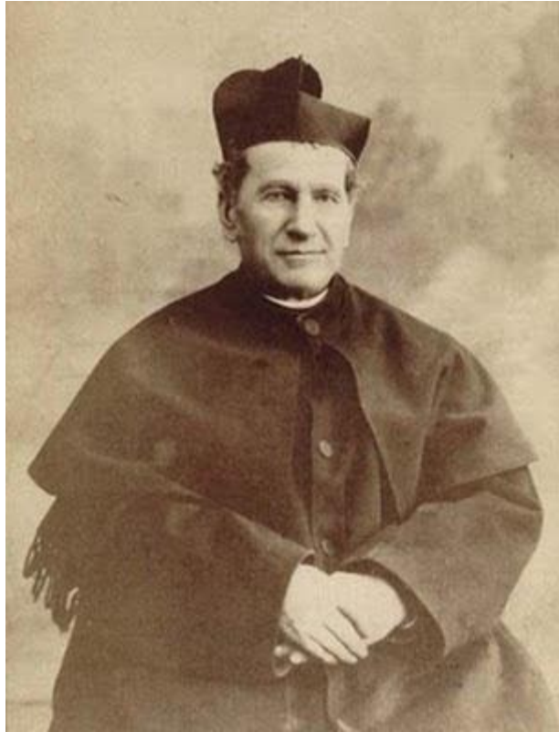
Phép lạ của các thánh đối với các loài thú

Khi những con thú tương đối kém thông minh răm rắp tuân lệnh các thánh thật là một chuyện lạ lùng. Sách Chuyện Các Thánh đầy rẫy những câu chuyện về ảnh hưởng khác thường của các thánh đối với đủ mọi loài thú. Đường như Thiên Chúa ban cho các ngài một mối quan hệ lạ lùng với các loài thú là để lôi kéo con người đến với Ngài khi họ kinh ngạc trước những điều kỳ diệu mà Chúa đã tạo ra giữa các thánh và các thú dữ.