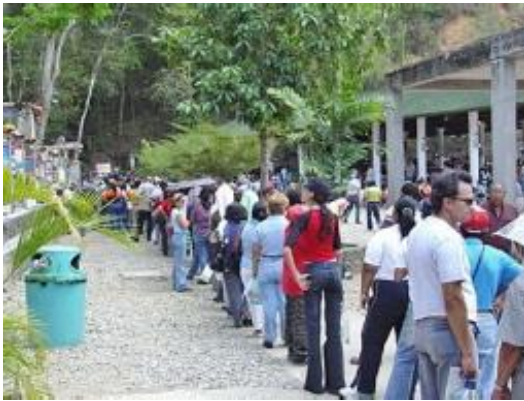
People queuing at the foot of the water falls in Finca Betania.

But the Virgin of Betania took off after 1984 when over a hundred people claim to have seen her on the anniversary of her apparition. Children started yelling that they'd seen the Virgin, drawing the rest of the worshippers to the grotto. In a span of three and a half hours, the Virgin appeared seven times, according to the devout who were at Betania that day.